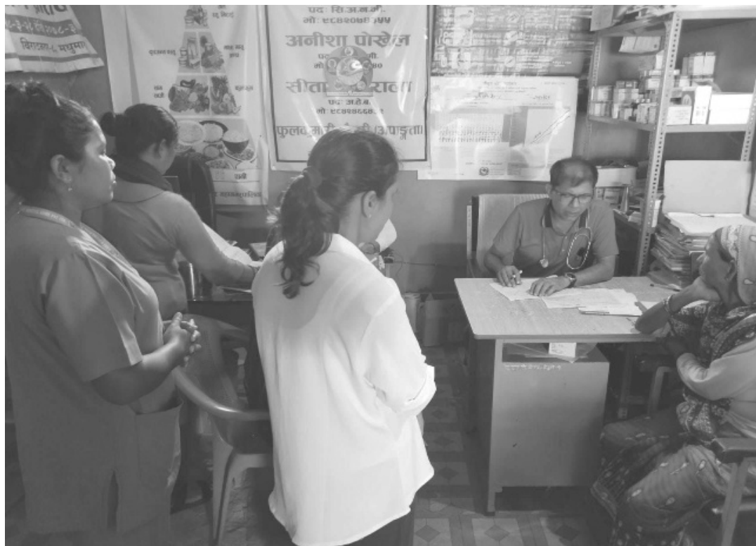
ग्रामीण संवादाता विराटनगर

विराटनगर महानगरपालिका वडा नं. ८ ले प्रत्येक महिनाको पहिलो र अन्तिम विहीवार महिला तथा स्त्रीरोग सम्बन्धि निशुल्क स्वास्थ्य शिविर शुरुगारिएको छ।