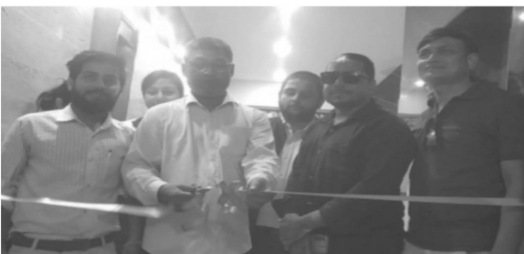
ग्रामीण संवादाता विराटनगर

विराटनगरमा लभयल Learning and consulting services नामक कन्सल्टेन्सी संचालनमा आएको छ। विराटनगर स्थित वडा नं १० शिक्षादिप कलेज अगाडि रहेको सो कन्सल्टेन्सीको मंगलवार उद्घाटन गरिएको छ, भने साउन १० गते वाट कक्षा संचालन हुने भएको छ।